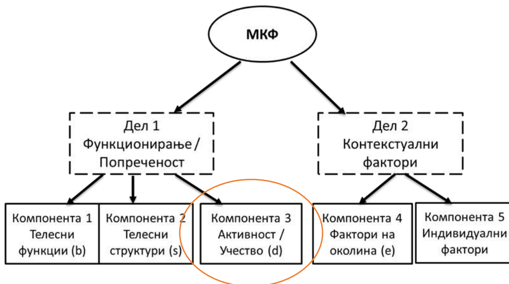
Слика 1: Структура на МКФ